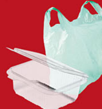
Sacs, boîtes en plastique