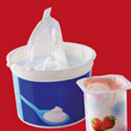
Pots de yaourt, de crème

Ces déchets ménagers non recyclables sont à déposer dans le bac des déchets ménagers (bac à couvercle bordeaux).