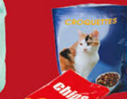
Sachets de croquettes, de chips