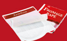
Barquettes de jambon, de fromage